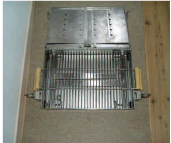
Herefter åbnes låget