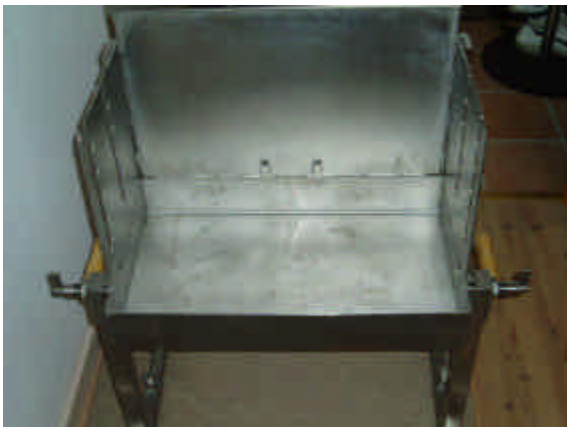
Grillen åbnes og siderne foldes ud