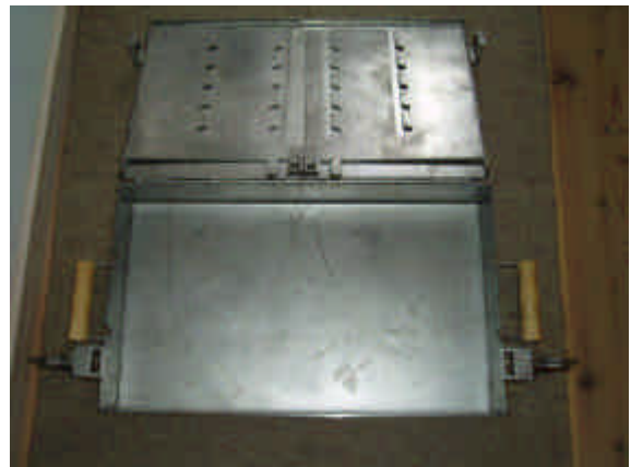
Benene tages op