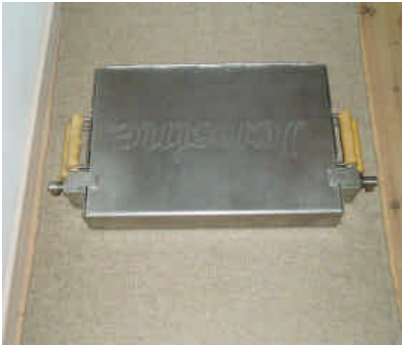
Grillen stilles og låse beslagene åbnes