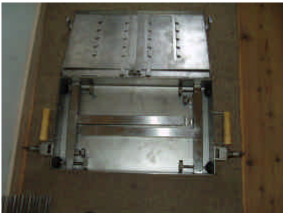
Risten tages op