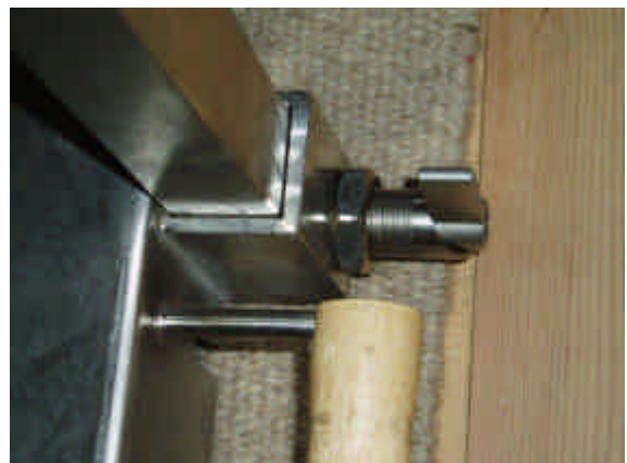
Benene foldes ud, sættes i og låses