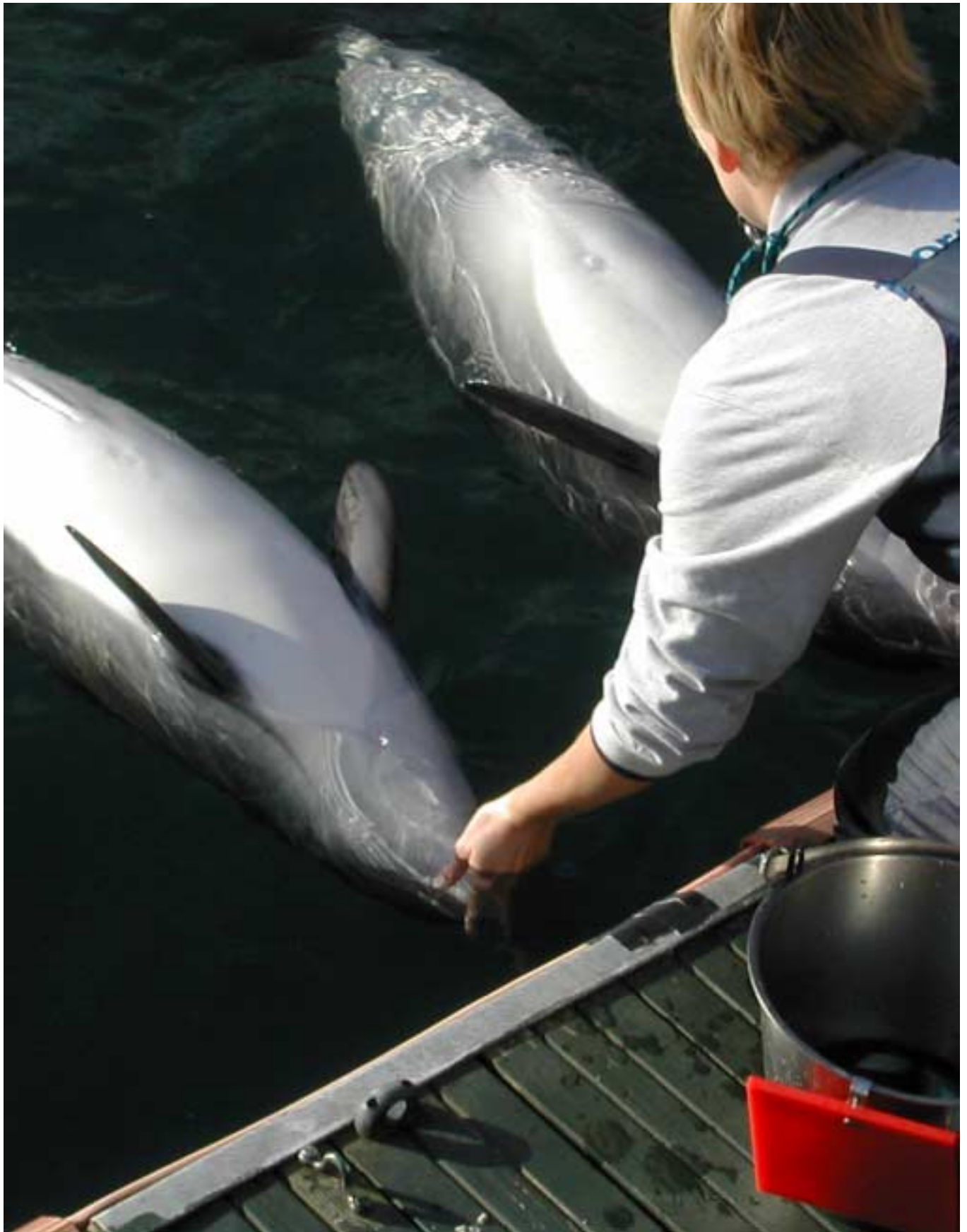
Marsvinene viser mave