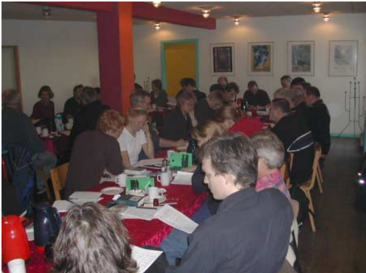
Regnskabet studeres nøje

Der vil blive lavet nye postkort, de gamle er tilbage fra 1975.