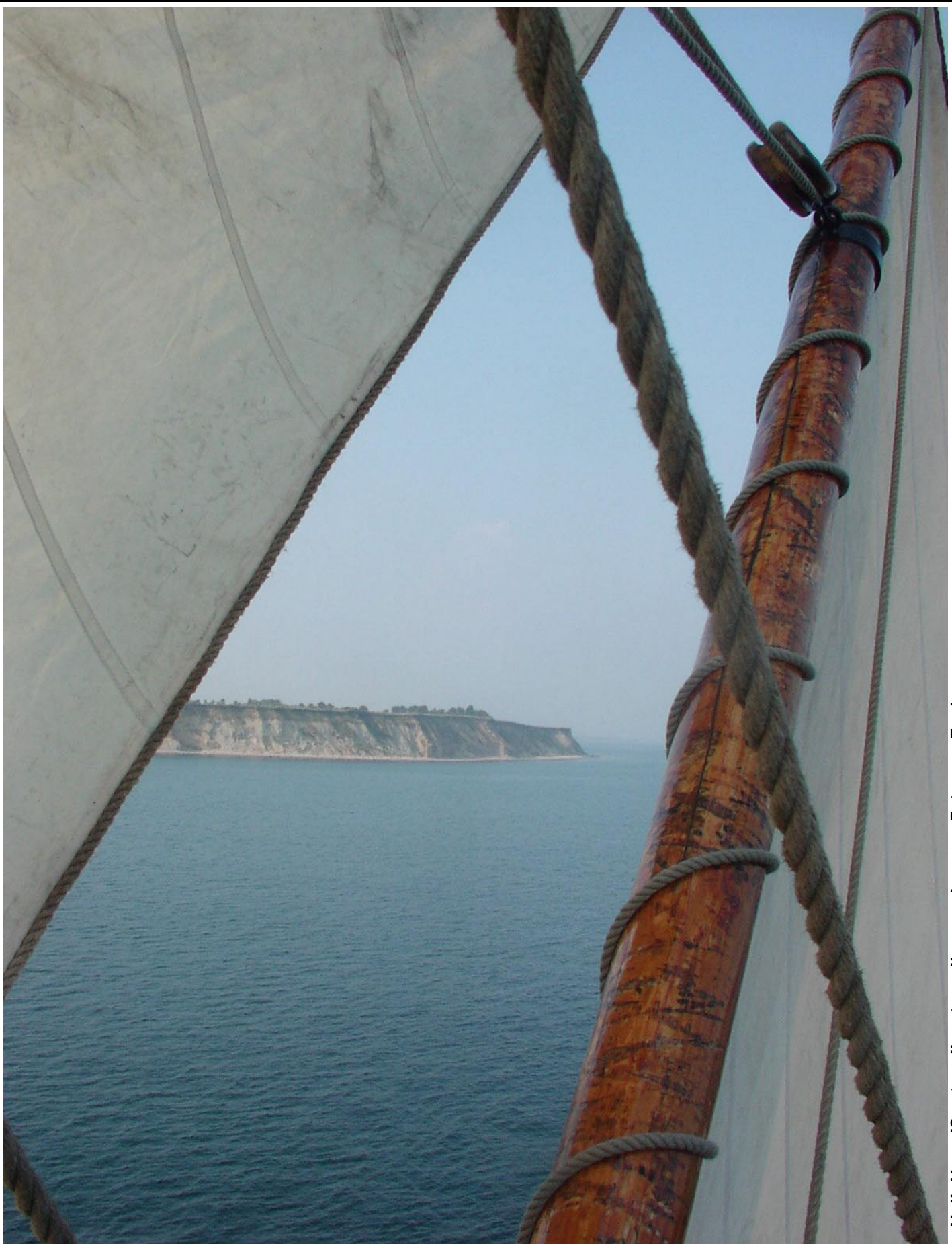
Halk Hoved? set mellem topsejl og peaken

EFTERRETNINGER FOR SKIBSLAGET, JENSINES VENNER OG ANDRE SØFARENDE